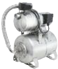
Sonderbau JEM 80/120/150 VA-Kessel und Motorgehäuse aus Edelstahl

Einsatzgebiete: Zum Betrieb mehrerer Regner, zur Gartenbewässerung, Befüllen/Entleeren von Becken und Behältnissen, Wasserversorgung für Häuser (Wochenendhäuser etc.). Fördern von Flüssigkeiten in Industrie, Gewerbe und Landwirtschaft. Für Dauerbetrieb geeignet.