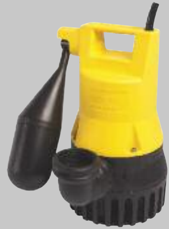
U 5 KS