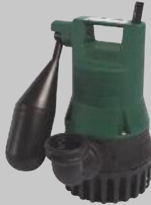
U 3 KS Spezial