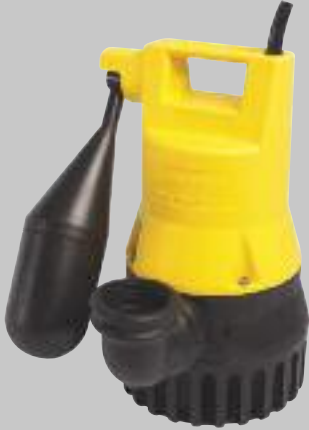
U 3 KS

Anwendungen: Fördern von Regenwasser, leicht verschmutztem Wasser und häuslichem Abwasser, auch aus Haushaltsgeschirrspülern und Waschmaschinen.